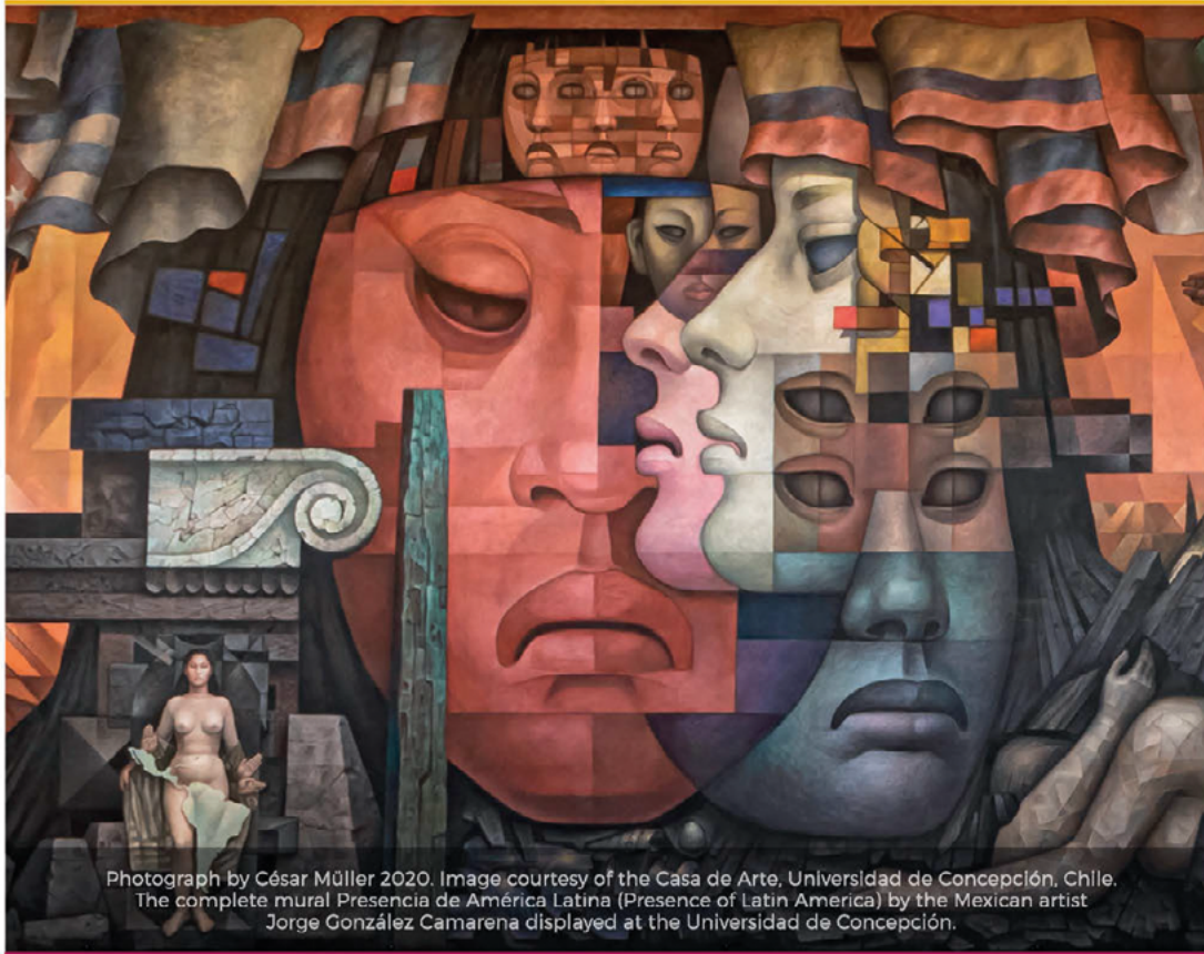
The complete mural Presencia de América Latina (Presence of Latin America) by the Mexican artist Jorge González Camarena displayed at the Universidad de Concepción.

The Latin American Cultural Center (LACC) is an exciting new outreach initiative of the Latin American Studies Association in its headquarters building in Pittsburgh, Pennsylvania. The mission of the Latin American Cultural Center is to celebrate Latin America through compelling programs dedicated to fostering a heightened understanding and appreciation for Latin American arts, history, and culture.